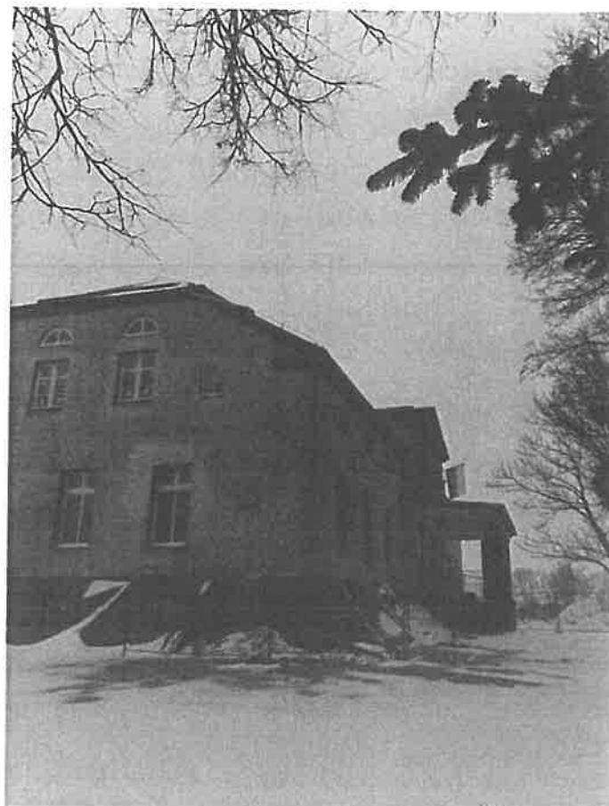
Fot.1. Ogólny widok – wejście.

Podczas kontroli obiektu w dniu 16.12.2018 r. Nie stwierdzono występowania zwierząt o obrębie budynku. Sam obiekt objęty jest pracami remontowymi – do części budynku nie można było się dostać z uwagi na zabezpieczenia. Budynek ma nowe pokrycie dachowe wraz z opierzeniem. Wystkie widoczne otwory wentylacyjne były zabezpieczone. Obiekt nie stanowi preferowanego miejsca zimowania nietoperzy – brak kryjówek mogących zapewnić stałe warunki temperaturowe i wilgotnościowe.