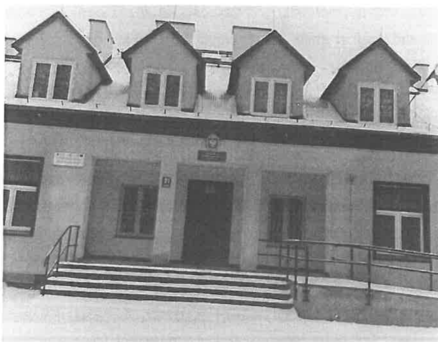
Fot.1. Ogólny widok – wejście.

Obiekt nie stanowi preferowanego miejsca zimowania nietoperzy – brak kryjówek mogących zapewnić stałe warunki temperaturowe i wilgotnościowe.