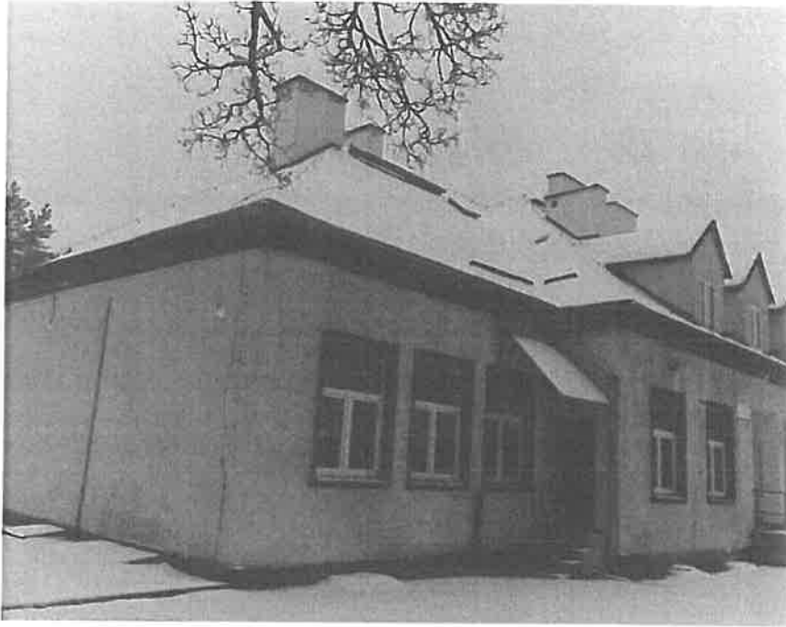
Fot. 4. Budynek SP w Kosewie