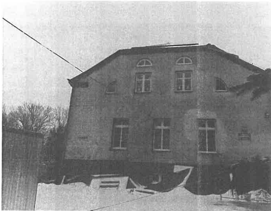
Fot. 2. Nowe pokrycie dachowe oraz opierzenie są w b. dobrym stanie.