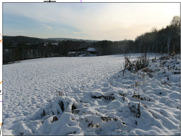
Zdj. 7 – zbocze po wschodniej stronie drogi. W dół widoczny najbliższy budynek mieszkalny.