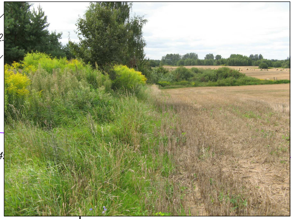
Zdj. 3 – granica między użytkiem rolnym i terenami ugorowanymi przy północnej granicy terenu opracowania.