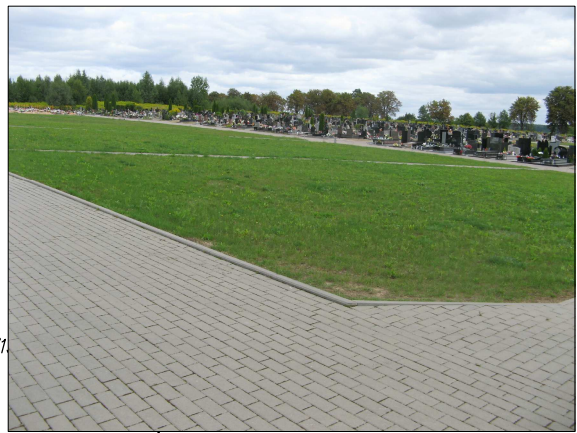
Zdj. 1 – kwatery cmentarne jeszcze wolne.