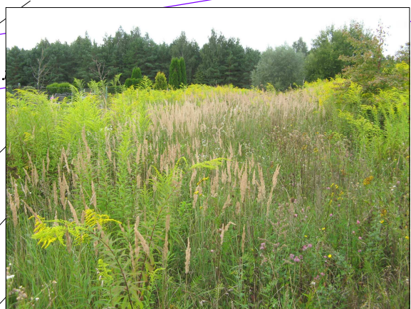
Zdj. 2 – zieleń niska przy północnej granicy cmentarza. W głębi zieleń wysoka też wyrosła spontanicznie.