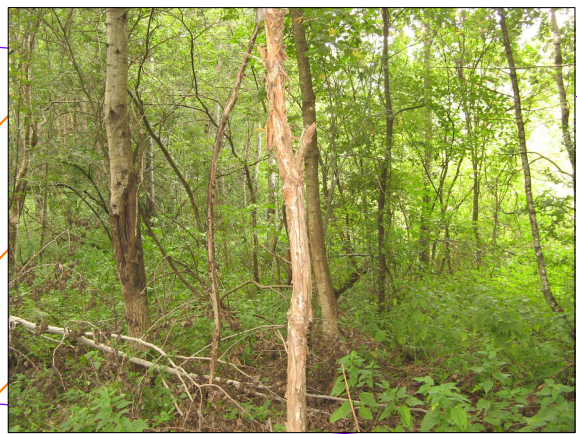
Zdj. 4 – zadrzewienia liściaste w dolinie na zboczu.