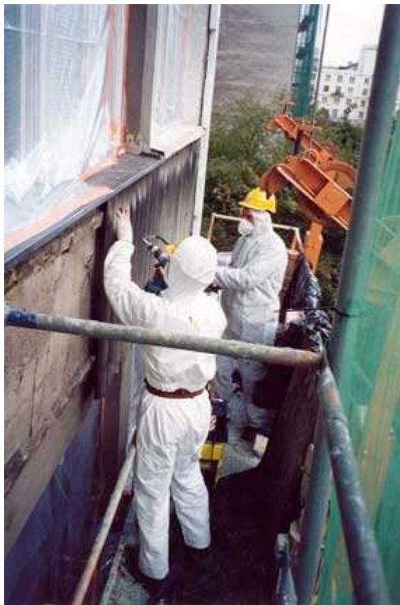
Rysunek 3 Przygotowanie wyrobów azbestowych do transportu: