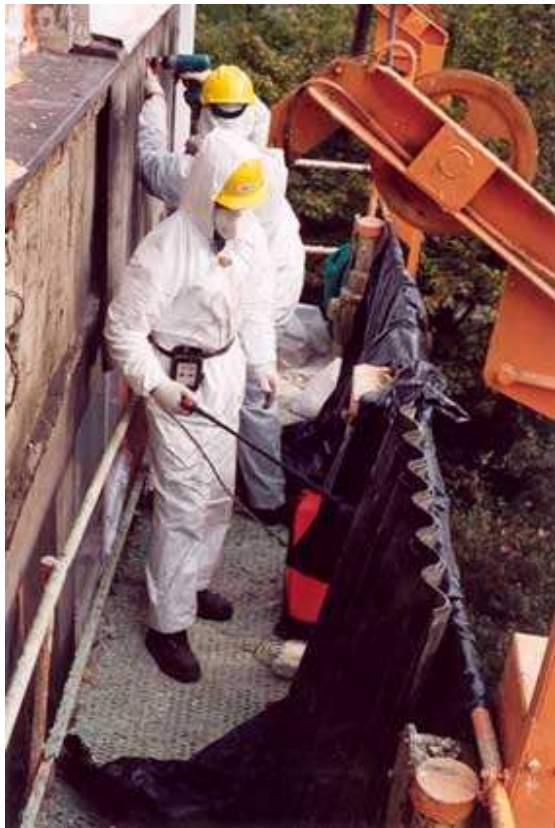
Rysunek 2 Usuwanie wyrobów azbestowych:

Poniżej przedstawiono sposób prawidłowego postępowania przy usuwaniu, demontażu i rozbiórce elementów azbestowych