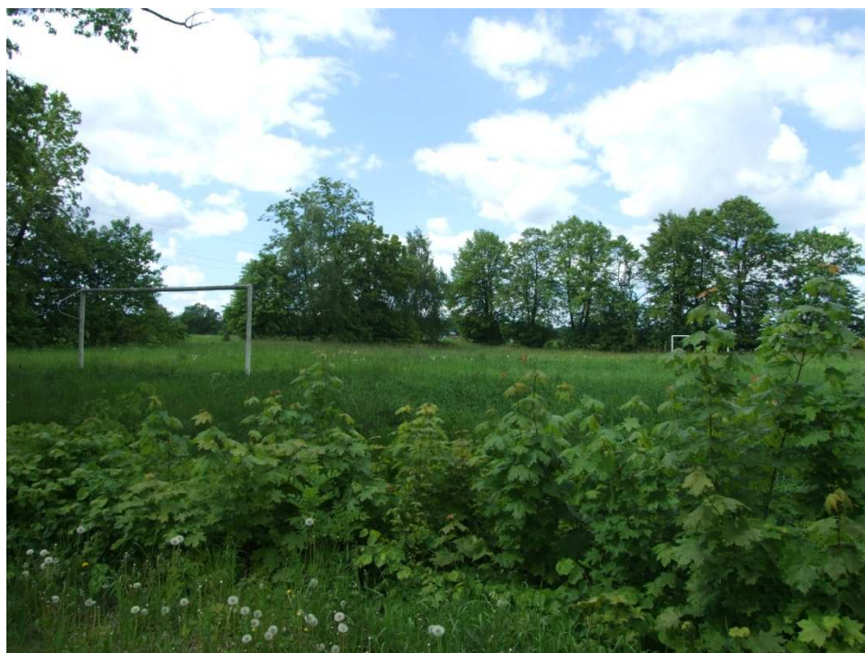
Boisko sportowe- stan obecny