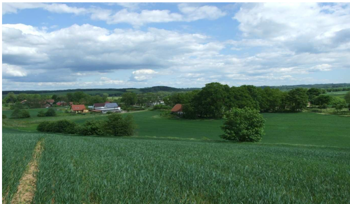
Widok na wieś od strony Czarnego Lasu

komfortu mieszkaniowego. Typowy charakter rolniczy wsi powoli, lecz zdecydowanie zaczyna ustępować nastawieniu na agroturystykę i turystykę. Spowodowane jest to malowniczym położeniem miejscowości, bliskością do Mrągowa, oraz naturalnemu odizolowaniu wsi od zgiełku hałasu ulic i miasta. Na dzień 31.XII.2010 r. Popowo Sałęckie zamieszkiwało 131 osób.