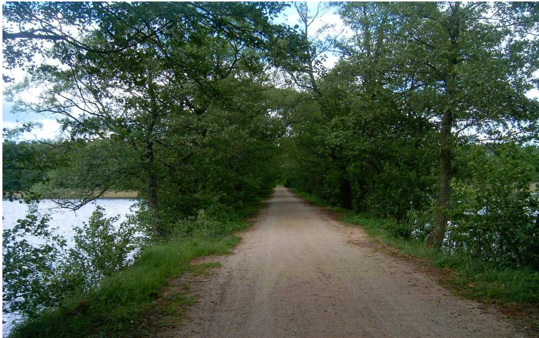
Nasyp linii kolejki wąskotorowej