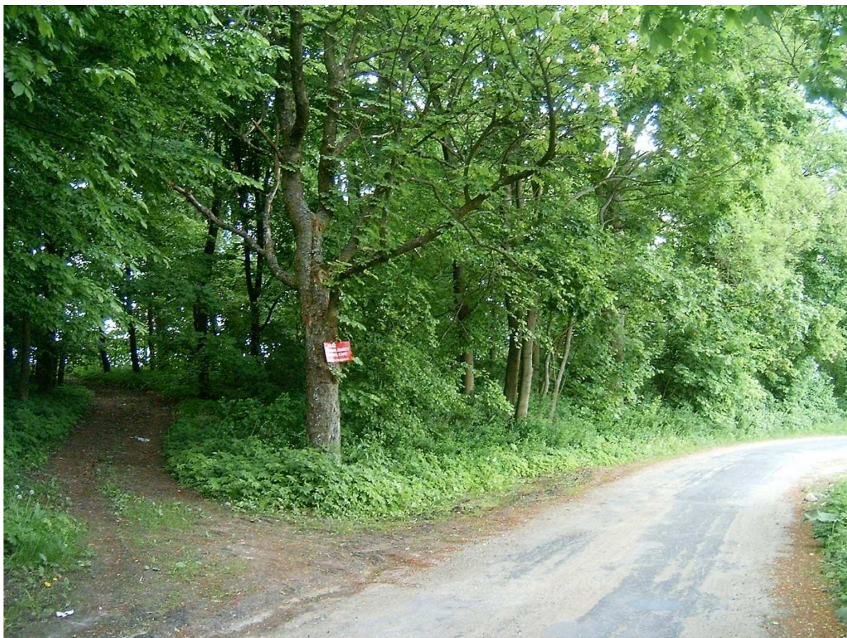
Park Folwarczny- stan obecny