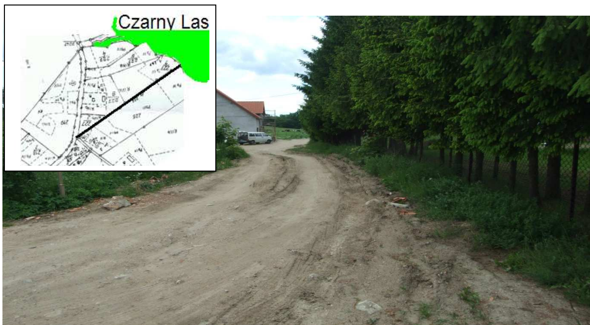
Droga na Czarny Las – stan obecny