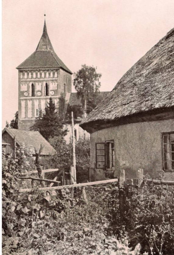
Widok na zabudowę wsi i wieżę kościoła w Szestnie