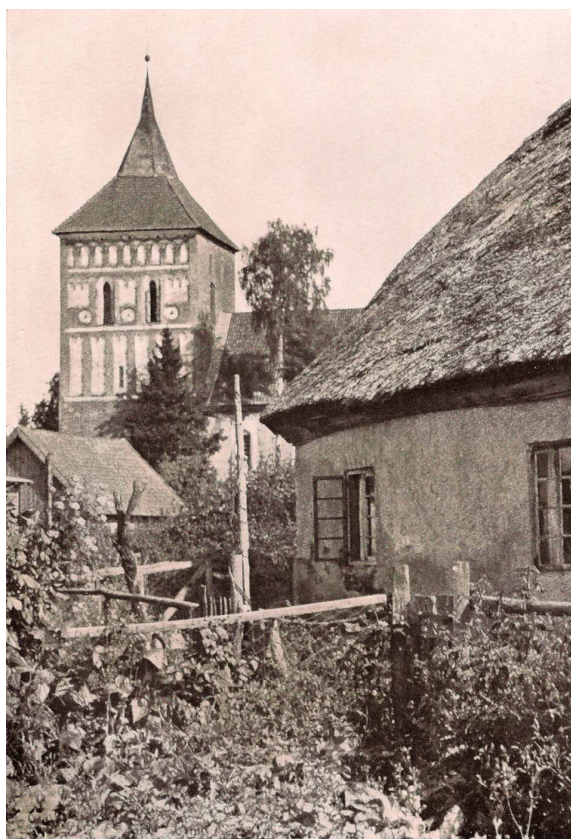
Widok na zabudowę wsi i wieżę kościoła w Szestnie

Historia ziemi mrągowskiej sięga czasów średniowiecza, kiedy to Krzyżacy podbili żyjące tu plemiona pruskie i utworzyli własne państwo. Po latach sporów z Kościołem, edyktem papieskim z 1374 roku, ustalono granicę z katolicką Warmią i ziemia mrągowska znalazła się w państwie krzyżackim. Podstawową jednostkę stanowiły tu komturie, a mniejsze – prokuratorie i wójtostwa. W latach 1401–1525 prokuratorzy krzyżaccy rezydowali na zamku w Szestnie (Seehesten), który stanowił ważne ogniwo łańcucha twierdz obronnych, rozlokowanych południkowo po zachodniej stronie Wielkich Jezior Mazurskich.